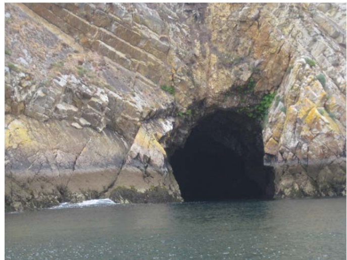
De kustgrotten bij Margot in Bretagne waar je met een boot naar binnen vaart.