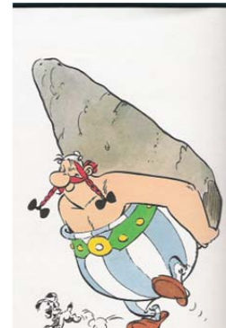
In Carnac bezochten we de menhirs. Ze zijn niet te tillen !!!