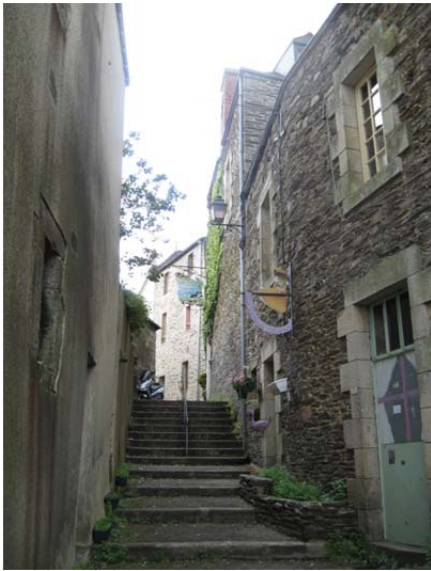
In Bretagne gingen we naar het mooie oude Franse dorp Rochefort en Terre, een prachtig dorp.