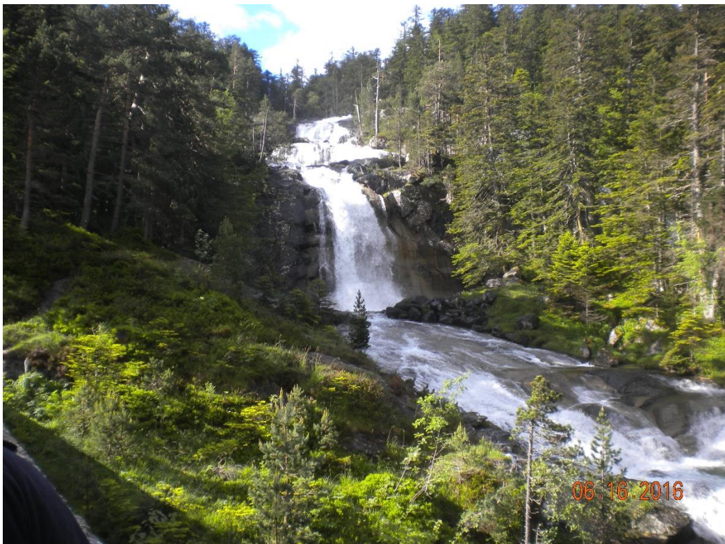
Gavarnie met z'n prachtige watervallen