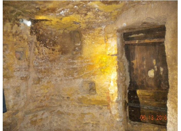
We bezochten de grotwoningen uit de 12 e eeuw