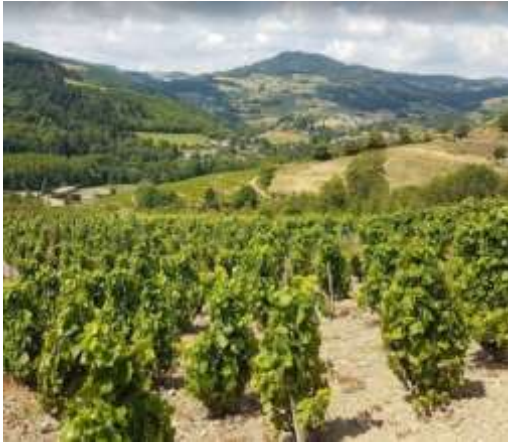
Kapel “de Madonna” te midden v.d. wijngaarden