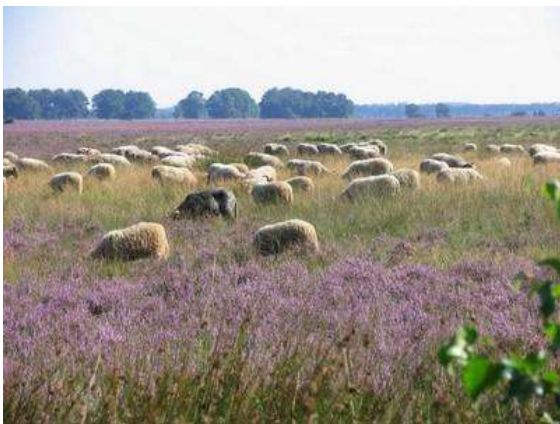
Nationaal Park Dwingelderveld

In Drenthe kunt u prachtige wandelingen maken. Van diverse natuurwandelingen tot wandelingen door gezellige dorpjes. Lekker aan de wandel in Drenthe? Vanaf de camping loopt je rechtstreeks Nationaal Park Dwingelderveld in. In onze receptie van de camping worden wij voorzien van informatie over wandelen in Drenthe. Ook kunnen wij een leuke wandeling maken door de monumentale dorpje Orvelte. Beilen en Dwingeloo, nabij Camping Meistershof, zijn eveneens prachtige plekken om in Drenthe te wandelen.