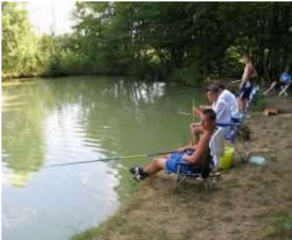
Voor de visliefhebber is er een mooie visvijver.

En op zijn tijd kan ook een BBQ geregeld worden.