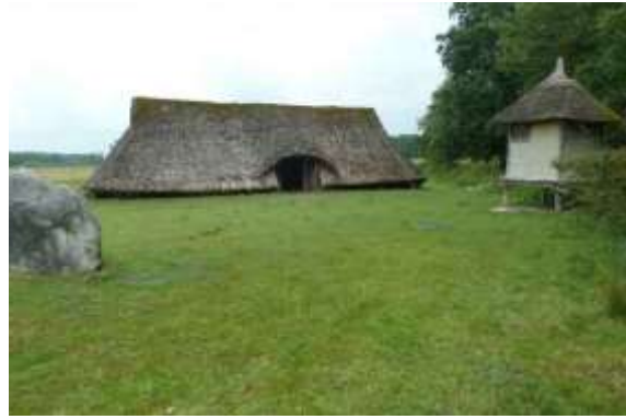
Museum dorp Orvelte.

In Drenthe kunt u prachtige wandelingen maken. Van diverse natuurwandelingen tot wandelingen door gezellige dorpjes. Lekker aan de wandel in Drenthe? Vanaf de camping loopt je rechtstreeks Nationaal Park Dwingelderveld in. In onze receptie van de camping worden wij voorzien van informatie over wandelen in Drenthe. Ook kunnen wij een leuke wandeling maken door de monumentale dorpje Orvelte. Beilen en Dwingeloo, nabij Camping Meistershof, zijn eveneens prachtige plekken om in Drenthe te wandelen.