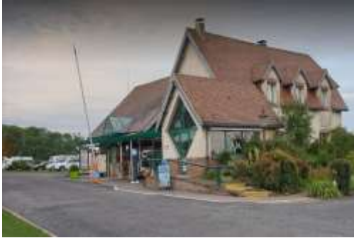
Entree van de eerste camping