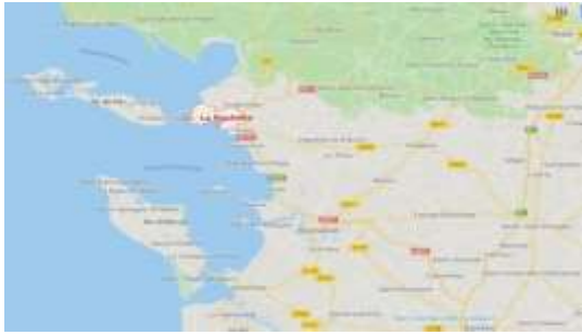
Kaartje van de omgeving