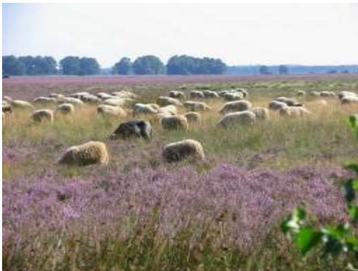
Nationaal Park Dwingelderveld