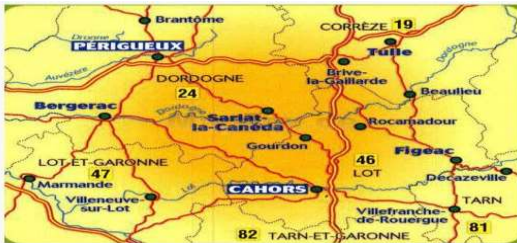
De omgeving van de Dordogne, waar we diverse excursie hopen te maken.

Dan rijden we door richting de camping nabij Clermond Ferrand.