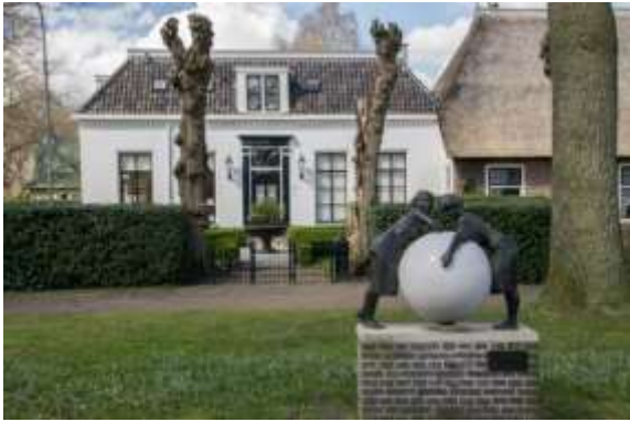
Havelte, een mooi Drens dorpje.