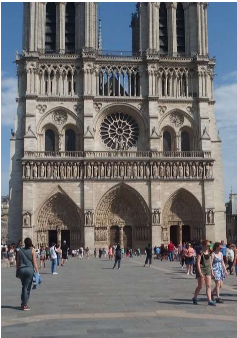
De Notre Dame in betere tijden