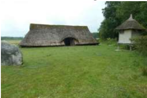
Museum dorp Orvelte

Veenpark is het grootste museum van Nederland. Reis met treinen en het turfschip, de bakker, de turfsteker, de klompenmaker en de kruidenier wordt ons verteld en getoond.