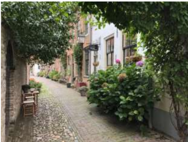
Een doorkijkje in Buren

Ook hopen we de historische stadjes Buren en Amerongen te bezoeken.