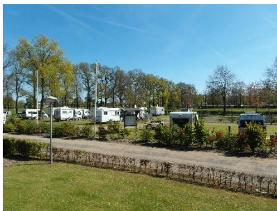
loopafstand van het bos.

Aan de andere kant van de camping tevens op loopafstand vindt u Haaksbergen met verrassend leuke winkels en gezellige terrasjes. Voor de toeristische gast zijn 2 prachtige velden beschikbaar met zeer ruime plaatsen (min. 100 m 2 ) voor maximaal 90 caravans- tenten- of vouwwagen, reserveren is mogelijk niet verplicht, voor 2 personen vanaf € 24,50