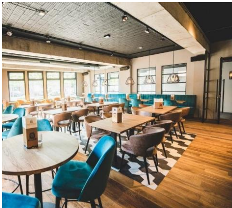
Restaurant De Hof van Gilzen Steenakkerplein 2, Gilzen